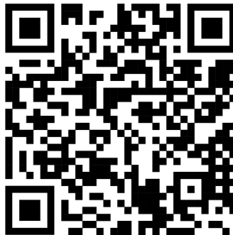
Abbildung 2: Download Chargewell App

Die Chargewell App kann für iPhones im Apple Store kostenlos heruntergeladen werden. Für Smartphones mit dem Betriebssystem Android steht die App im Play Store zum Download zur Verfügung.